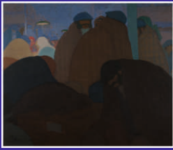
Los emigrantes, 1912