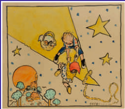
Composición, c. 1926-1928