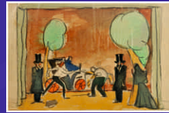
Escena, c. 1918-1923