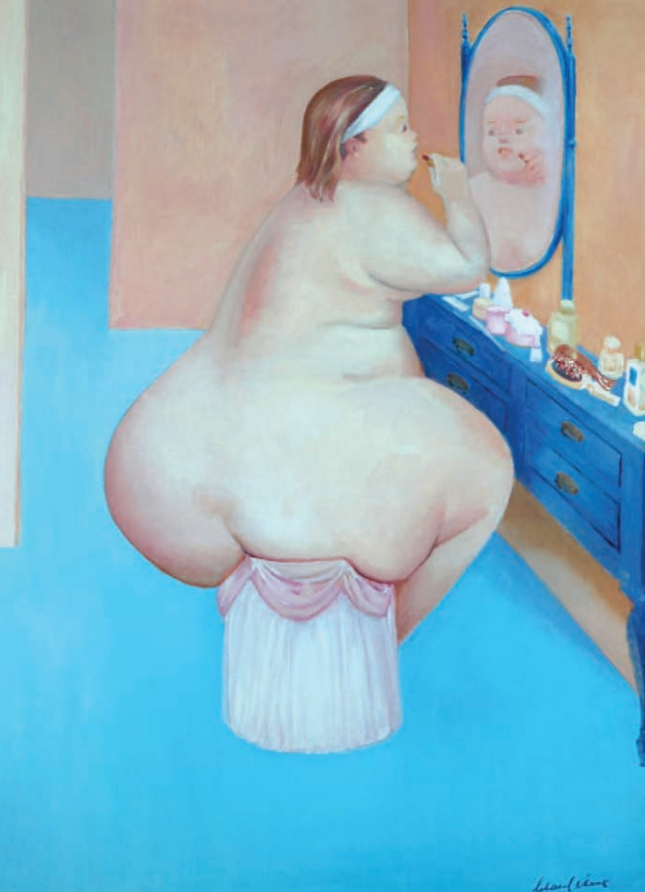
> Triple Óleo sobre tela 116 x 89 cm. 1980