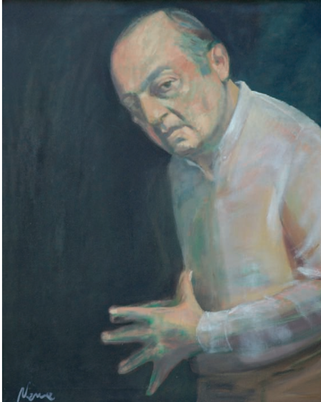
> Autorretrato sobre Berna Óleo sobre tela 130 x 97 cm. 1963