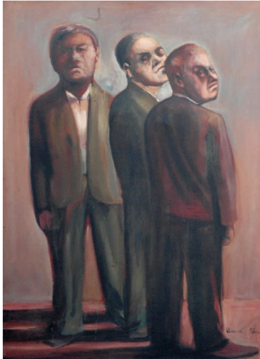
> Motoqueras Óleo sobre tela 97 x 130 cm.