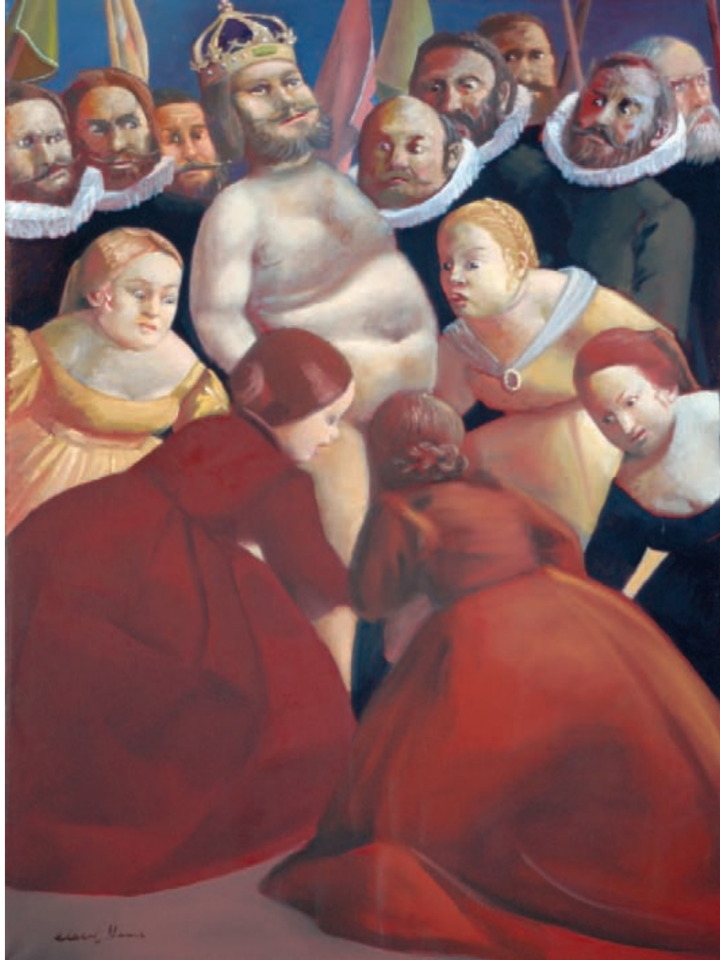
> La reina desnuda Óleo sobre tela 164 x 130 cm. 1964