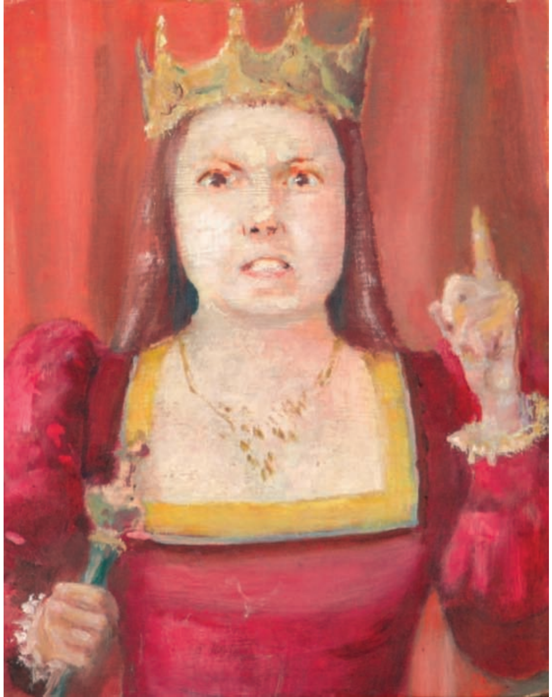
< Reina desconfiada Óleo sobre tela 39 x 30 cm. s/fecha