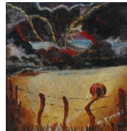
Óleo que Neme pintó a los 16 años y firmó con el pseudónimo "El de turno", del que Osmar habla en su texto.

5. Fue durante un largo viaje en tren a la Bienal de São Paulo durante tres días cuando Clarel me relató parte de sus experiencias anteriores en la pintura.