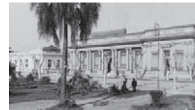
Liceo Departamental al que concurría Neme. A la derecha el Banco República de Rivera, desde la plaza Río Branco (Hoy Plaza Artigas) 1939 / Fotografía: Adolfo Gil / Archivo Digital Osmar Santos.