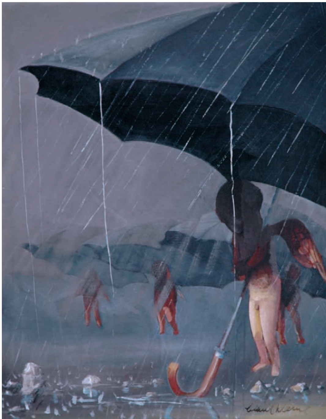
Angeles con paraguas Óleo sobre tela 92 x 73 cm. 1975