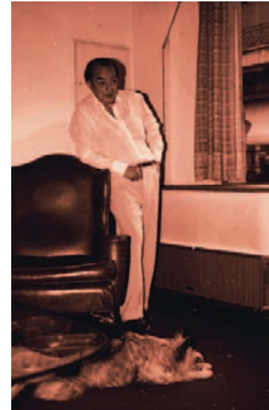
Clarel y Júpiter