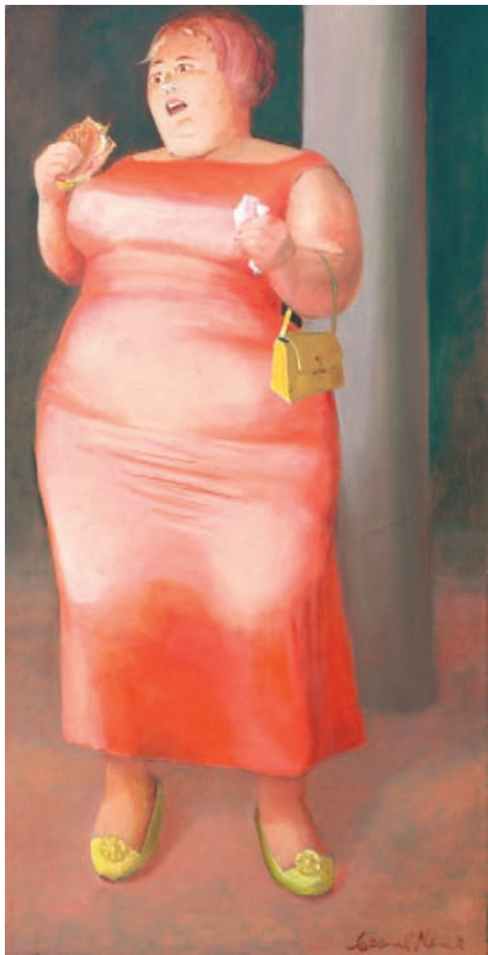
Comiendo hamburguesa Óleo sobre tela 120 x 60 cm. 1980