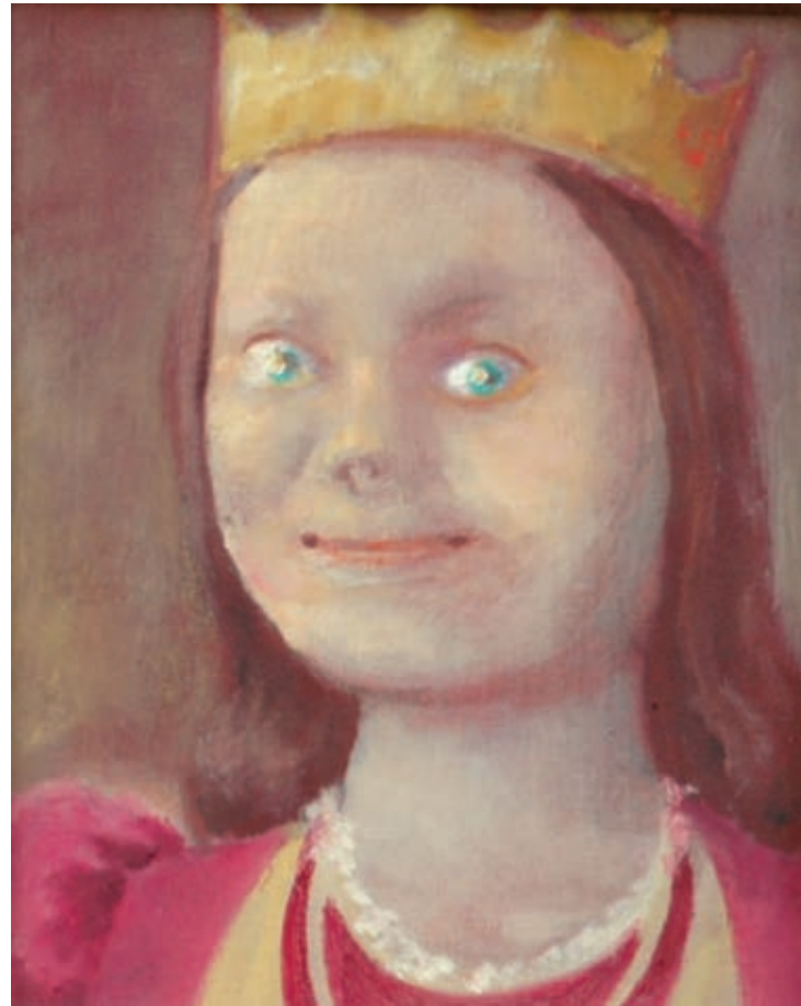
Reina que se tragó a ratón Óleo sobre tela 24 x 19 1990