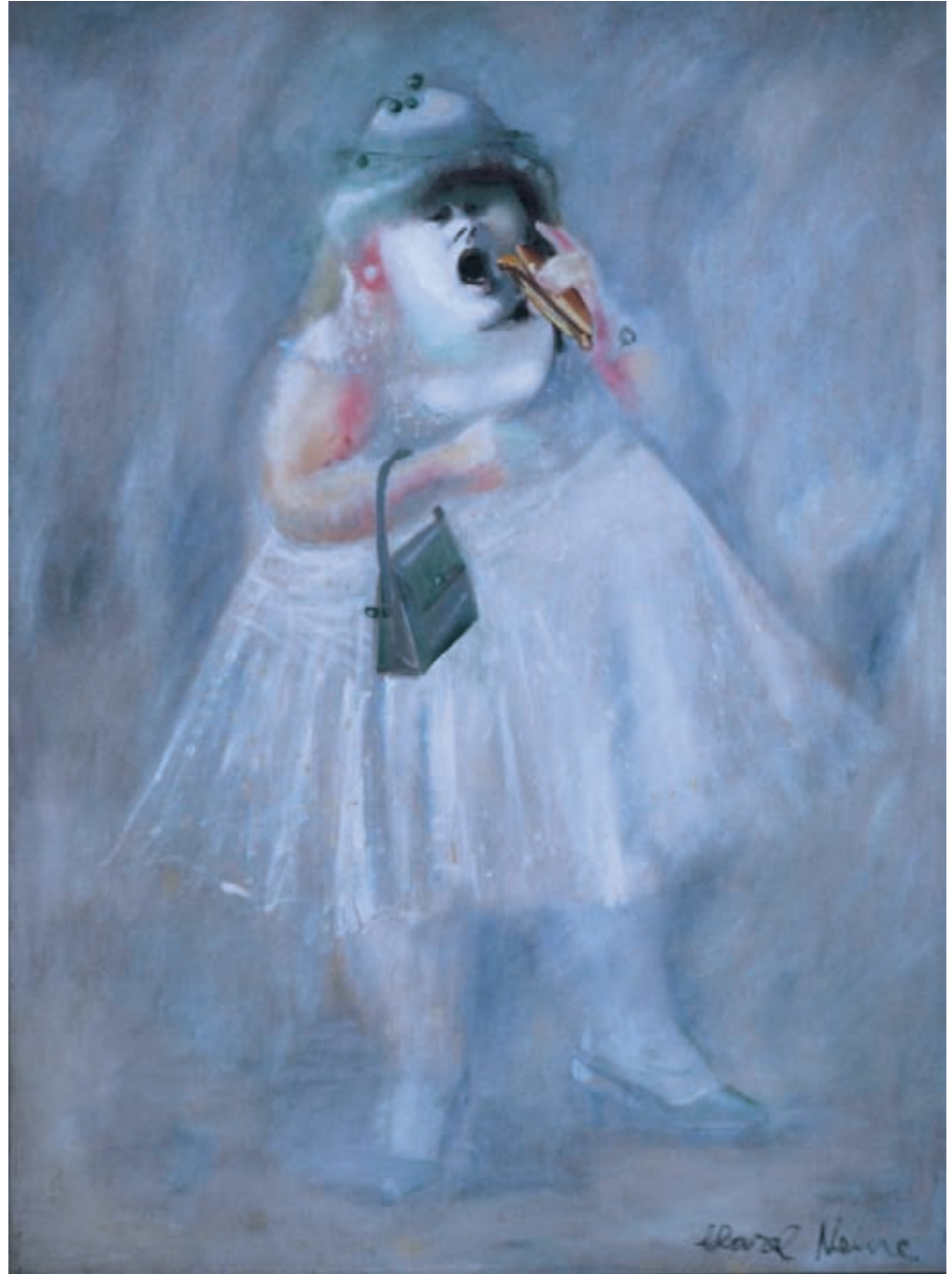
Una tarde feliz Óleo sobre tela 130 x 97 cm. 1980