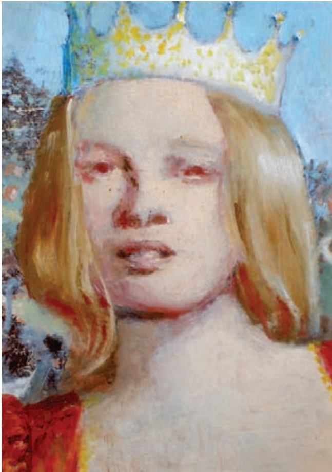
Reina enamorada Óleo sobre tela 25 x 16 cm. 2002