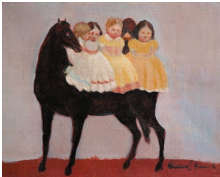
Cinco muñecas a caballo Óleo sobre tela 33 x 40 cm. 1987