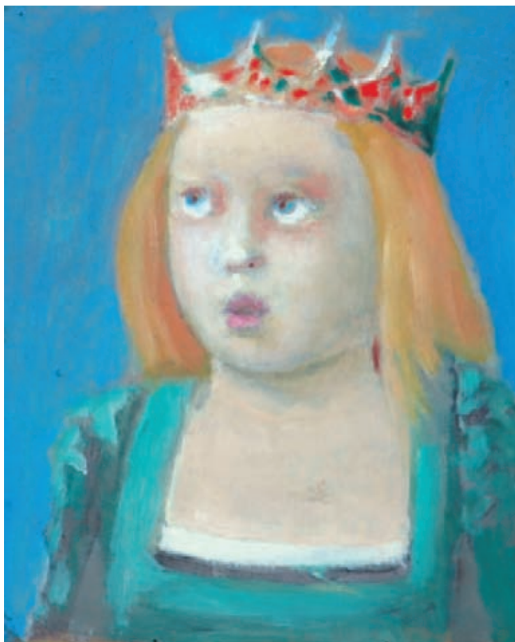
Reina boba Óleo sobre tela 28 x 22 cm. 1990