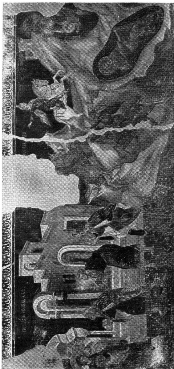
“La Adoración de los Magos, el regreso de los Magos; La aparición del Angel a José en sueño”.