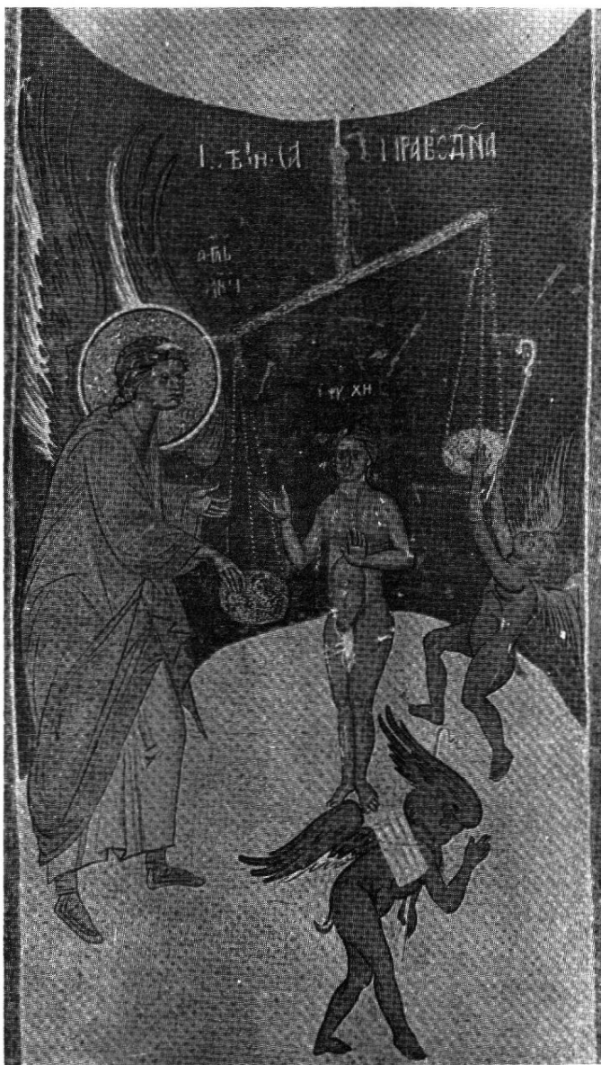
"La justa medida".