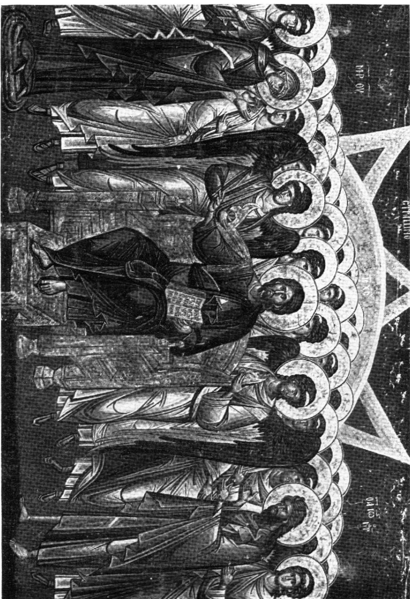
EL JUICIO FINAL.