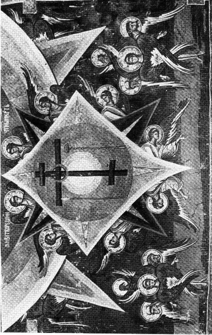
EL JUICIO FINAL.