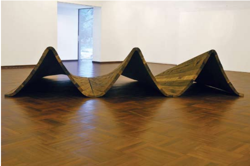
..... Irreversibilidad I