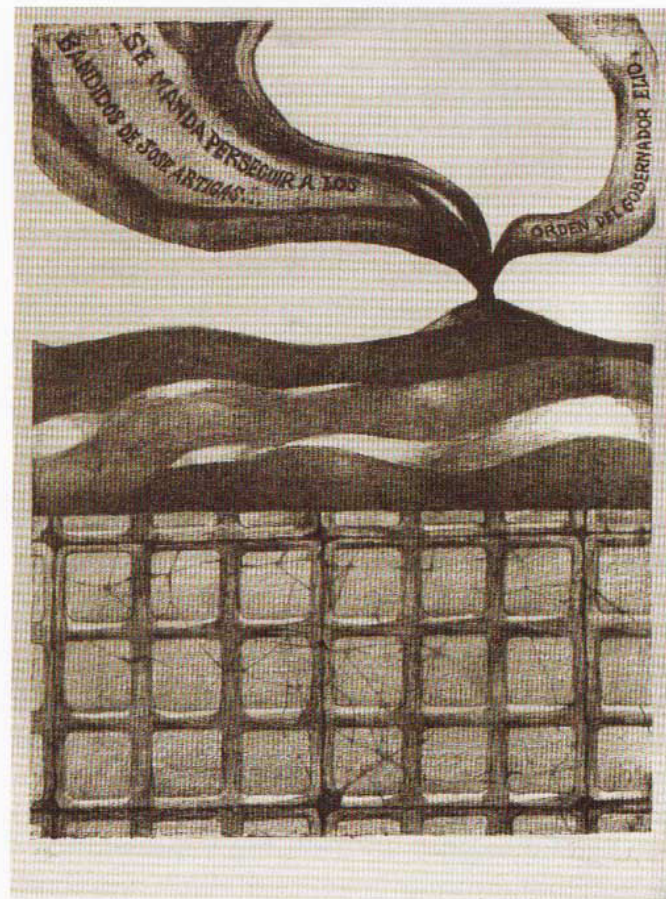
Catálogo (obras de la colección Oscar Ferrando)

las veredas de la Patria Chica, 1971 - 1972, 7 grabados, 38.5 x 29.5 cm.